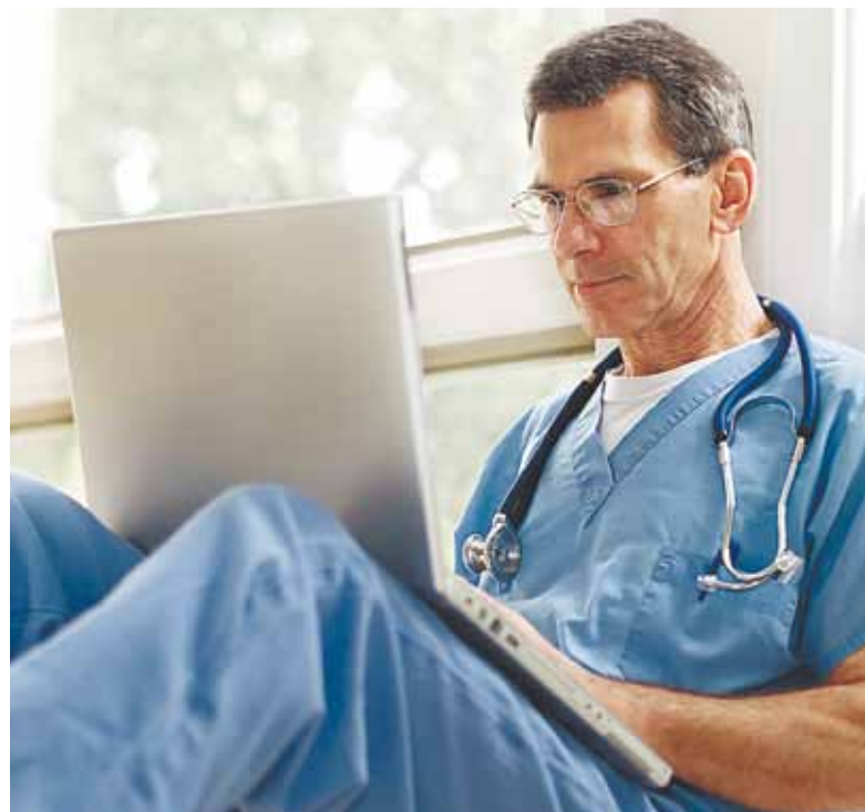
Со многими сайтами сотрудничают квалифицированные врачи.